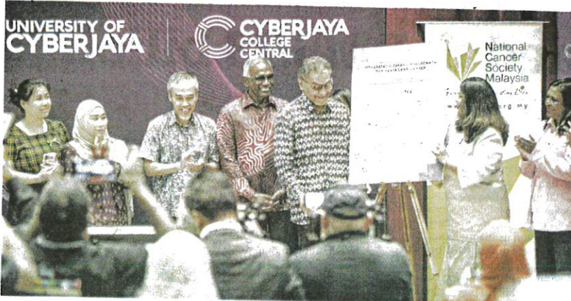
DR. DZULKEFLY (tiga dari kanan) ketika Majlis Perasmian Sambutan Hari Kanser Sedunia 2024 di Cyberjaya, Sepang semalam.

AKHBAR : KOSMO AHAD MUKA SURAT : 6 RUANGAN : NEGARA