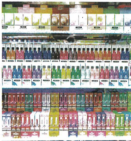
RAMAI pelajar di Britain ketagih menggunakan vape. – YAHOO

Antara masalah kesihatan yang dihadapi termasuklah penyakit ulser, sesak nafas dan batuk. – AGENSI