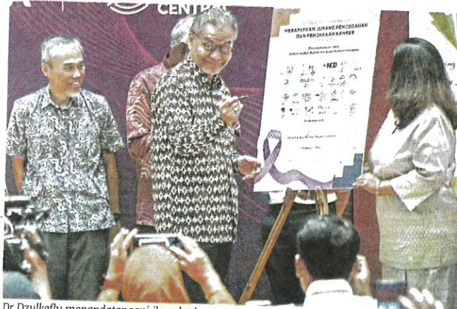
Dr Dzulkefly menandatangani ikrar kerjasama merapatkan jurang pencegahan dan penjagaan kanser pada Sambutan Hari Kanser Sedunia di Universiti Cyberjaya, semalam.