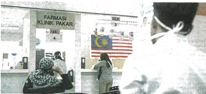
KKM menanggung kerugian angkara sikap warga asing yang culas bayar bil perubatan.

Mengikut laporan pada 2017, warga asing yang berhutang dengan Hospital Kuala Lumpur (HKL) sahaja mencecah RM7.87 juta dalam bentuk bil perubatan berbanding RM3 ju-